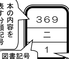
表 す 分 類 記 号