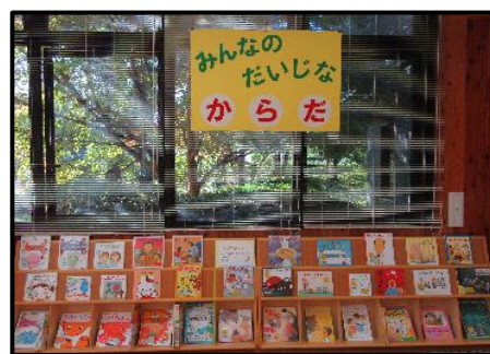
※昨年度の様子です

■連絡先 熊本県立図書館 子ども図書室 〒862-8612 熊本市中央区出水2丁目5-1 電話 096-384-5000