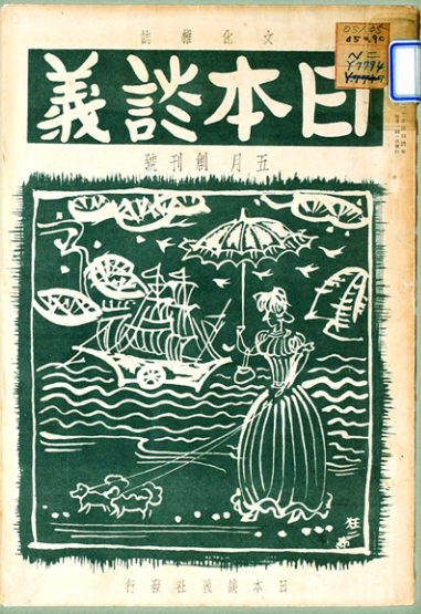
▶『日本談義』創刊号 昭和13年(1938年)5月 村上狂二画