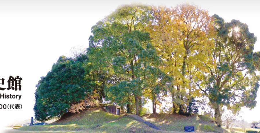
江田船山古墳(熊本県和水町)

令和5年度地域ゆかりの文化資産を活用した展覧会支援事業 Supported by the Agency for Cultural Affairs Government of Japan in the fiscal 2023