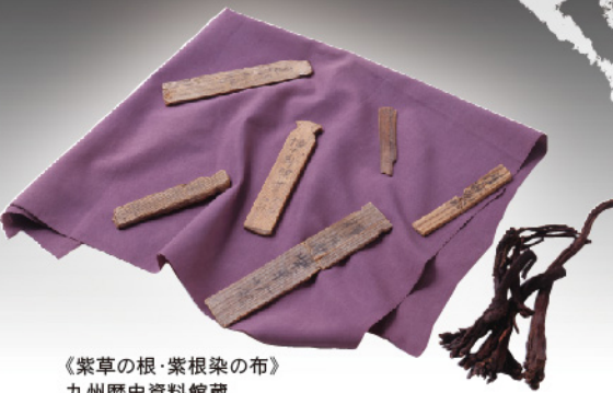
《紫草の根・紫根染の布》 九州歴史資料館蔵 ※木簡はイメージです。