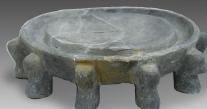
《獸脚円面硯》 熊本市・二本木遺跡群出土 8世紀 熊本市教育委員会蔵