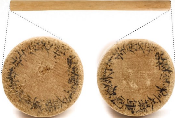
《平城宮木簡(肥後国第三益城軍団兵士歴名帳)》(部分拡大) 723年 奈良文化財研究所蔵 ※3/15~28展示

関連イベント 参加無料 お申込み先 TEL 096-384-5000(代表) 受付時間:9:30~17:00