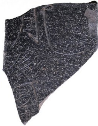
《熊本市・二本木遺跡群出土ヘラ書土器(肥後国)》(円面視) 8世紀 熊本市教育委員会蔵

《大宰府木簡(為班給筑前筑後肥等国遣基肄城稻穀隨...)》 8世紀 九州歴史資料館蔵 ※3/15~4/8展示