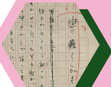
蓮田善明 原稿「恋のらくがき」