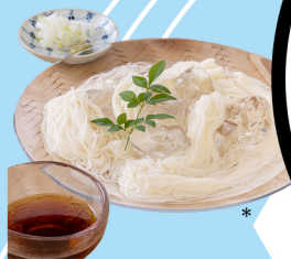
『名所名物 東肥名寄下』